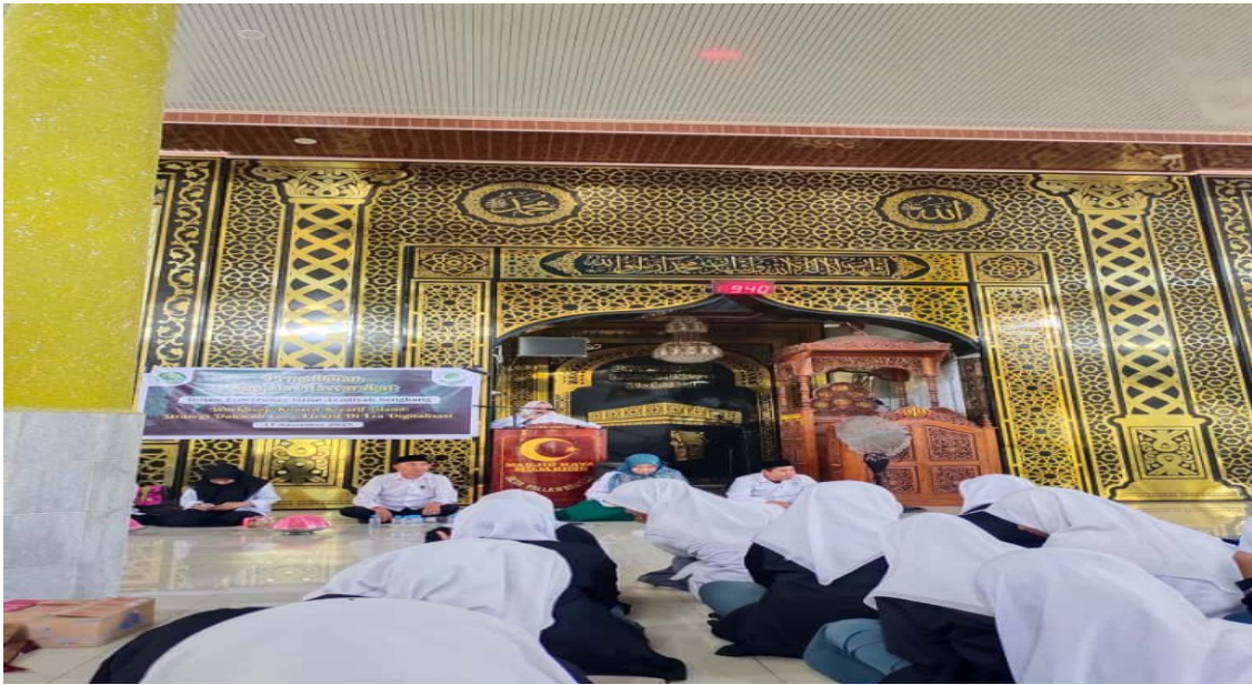
Gambar 2. Peserta didik yang Terlibat