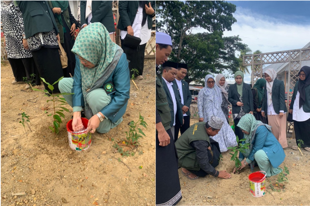
Gambar 2. Rektor Universitas Islam As'adiyah Sengkang Memimpin Gerakan Penanaman Pohon bersama Mahasiswa KKN dan Masyarakat Pompanua (16 Februari 2026)

Tingkat partisipasi yang melampaui ekspektasi ini mencerminkan keberhasilan strategi mobilisasi berbasis nilai keagamaan yang diterapkan dalam program ini. Berbeda dengan program penghijauan konvensional yang seringkali mengalami kesulitan dalam mempertahankan antusiasme masyarakat, pendekatan ekoteologi berhasil membangkitkan motivasi intrinsik yang bersumber dari keyakinan religius. Hare (2023) dalam kajiannya tentang gerakan lingkungan berbasis komunitas Muslim di Asia Tenggara menegaskan bahwa ketika individu memandang tindakan ekologis sebagai bentuk pengabdian kepada Tuhan, komitmen mereka terhadap keberlanjutan program terbukti jauh lebih kuat dan konsisten. Temuan lapangan ini mengonfirmasi relevansi pendekatan ekoteologi sebagai kerangka mobilisasi yang efektif untuk konteks masyarakat Muslim pedesaan Indonesia.