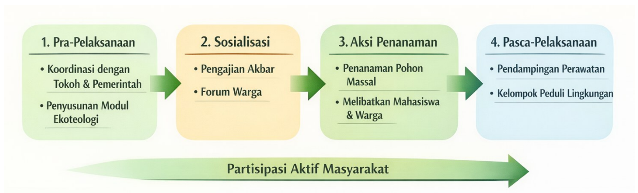
Gambar 1. Metode dan alur pelaksanaan kegiatan

lingkungan lokal. Pendekatan andragogi diterapkan untuk menjamin relevansi materi bagi peserta dewasa, sehingga pesan tentang tanggung jawab lingkungan dapat terinternalisasi secara lebih mendalam. Pada aspek teknis penanaman, digunakan demonstrasi langsung (demonstration plot) dan praktik terbimbing untuk memastikan setiap peserta memiliki keterampilan dasar dalam menanam dan merawat pohon. Jenis pohon yang ditanam dipilih berdasarkan kebutuhan ekologis lokal dan nilai manfaat bagi masyarakat, mencakup pohon mahoni ( Swietenia macrophylla ), trembesi ( Samanea saman ), mangga ( Mangifera indica ), dan nangka ( Artocarpus heterophyllus ). Evaluasi kegiatan dilakukan melalui dua instrumen utama: (1) pre-test dan post-test untuk mengukur peningkatan pemahaman peserta tentang ekoteologi, dengan skala penilaian 0-100; dan (2) lembar observasi partisipasi untuk mendokumentasikan tingkat keterlibatan aktif masyarakat selama kegiatan. Data yang terkumpul kemudian dianalisis secara deskriptif-kualitatif untuk memetakan capaian dan dampak program secara komprehensif.