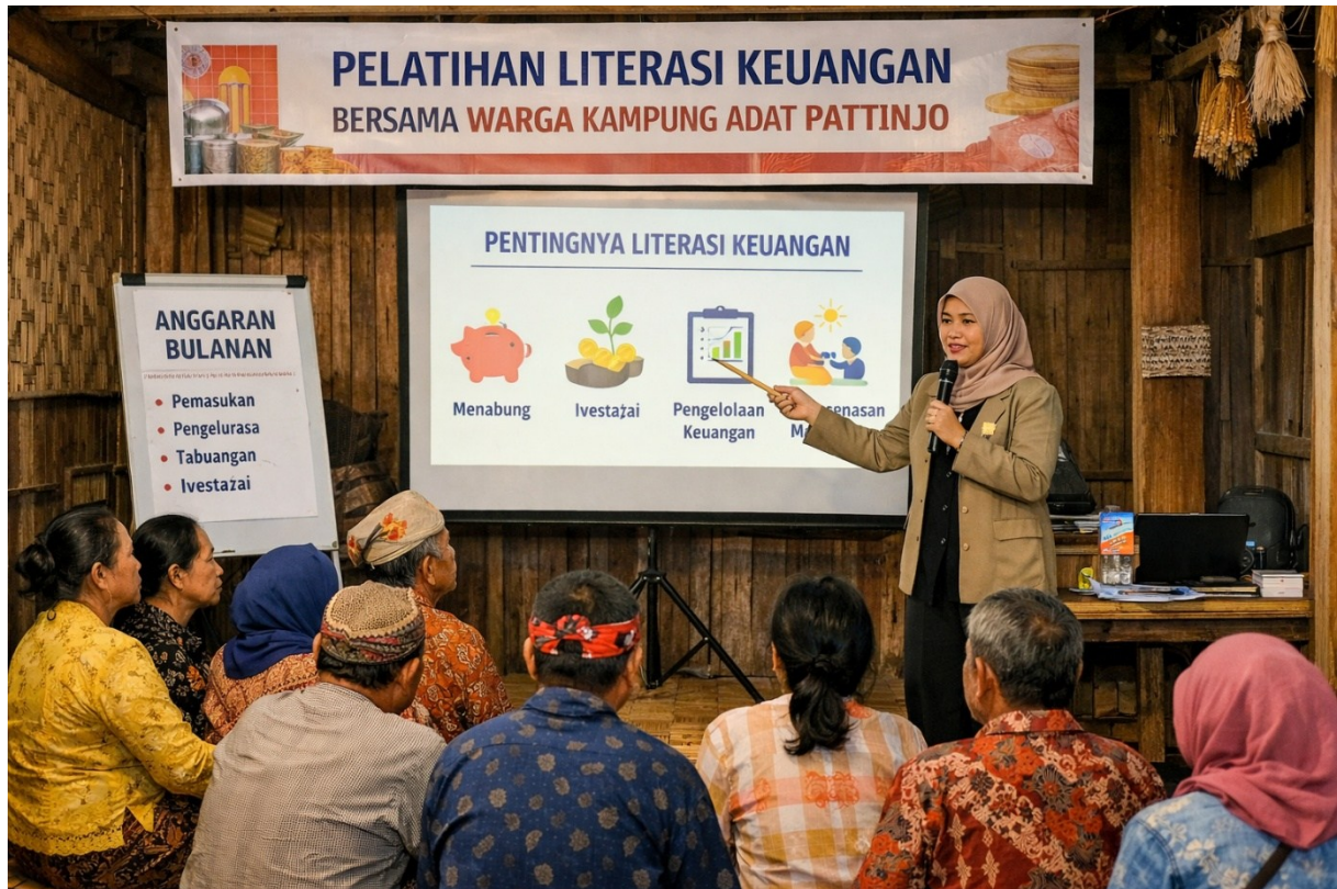
Gambar 1. Sesi Pelatihan Literasi Keuangan Bersama Warga Kampung Adat Pattinjo

Antusiasme masyarakat Kampung Adat Pattinjo dalam mengikuti seluruh rangkaian kegiatan sangat menggembirakan. Tingkat kehadiran rata-rata mencapai 93,3% dari total peserta terdaftar di setiap sesi, jauh melampaui target awal yang ditetapkan sebesar 80%. Kondisi ini menunjukkan adanya kebutuhan nyata (felt need) dari masyarakat terhadap pengetahuan dan keterampilan yang diberikan, sekaligus merefleksikan keberhasilan proses sosialisasi yang dilakukan oleh tim pengabdian bersama kepala adat dan tokoh masyarakat setempat sebelum kegiatan dimulai. Kepala Adat Pattinjo, dalam sambutannya pada sesi pembukaan, menyampaikan harapan besar agar kegiatan semacam ini dapat berlangsung secara berkelanjutan dan melibatkan lebih banyak warga kampung di masa mendatang.